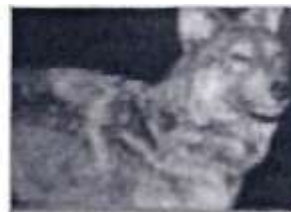
В. Ньюфаундлендский волк