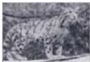
Б. Тайваньский дымчатый леопард