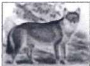
А. Фолклендская лисица

Все животные на фотографиях, кроме одного, больше не встречаются в живой природе. Выберите фотографию животного, которого ещё можно спасти.