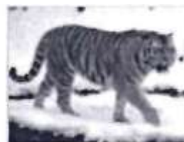
Г. Амурский тигр